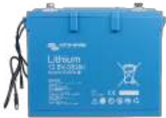
Batterie LiFePO4 12,8 V 330 Ah