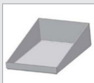
• Exemple de boîte