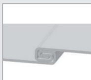
• Pliage double