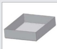
• Exemple de boîte