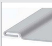
• Pliage simple