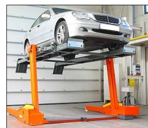
Accessoire: Chemins de roulement, capacité de 2.75 T