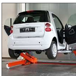
Ouverture libre des portes