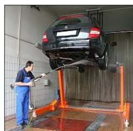
Option: Approprié pour l'environnement humide