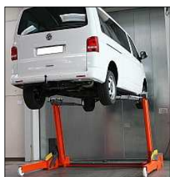
Pont utilisable pour mini-bus et utilitaire