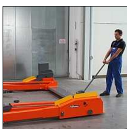
Pont facilement manœuvrable par une seule personne