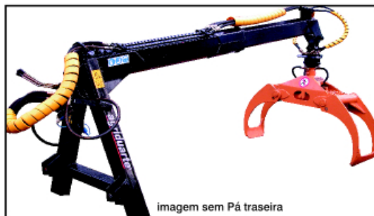
imagem sem Pá traseira