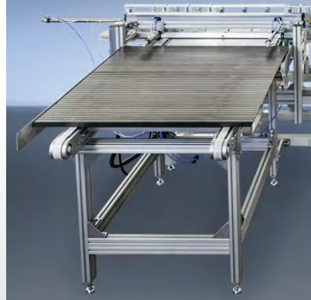
WKF 170 comme fraiseuse d'arête avec module d'avance et transporteur à rouleaux

Fraiseuse automatique de bord ZE 2000/2 d'ASSFALG