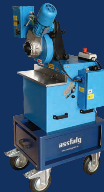
WKF 170 avec module d'alimentation et chariot