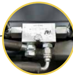
Soupape de blocage installée de série Standard equipped with blocking valve