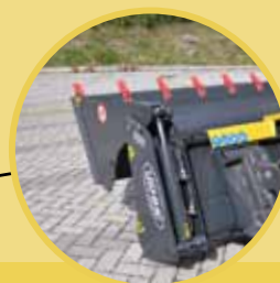
2 vérins hydrauliques à double effet 2 double effect hydraulic cylinders