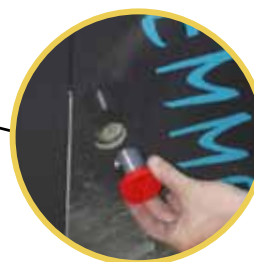
Dispositif de blocage de la mâchoire Grip blocking device