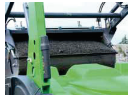
Une capacité de 600 Kg de gravier pour un volume de 400l!