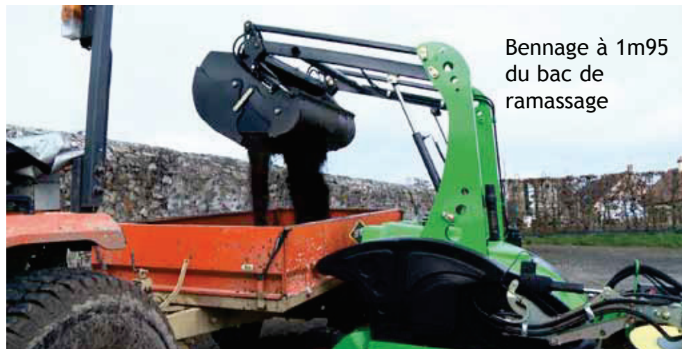
Bennage à 1m95 du bac de ramassage

Un triangle équipé d'une boule d'attelage s'adapte rapidement sur le relevage arrière du tracteur. Le chauffeur n'a plus qu'à reculer, et atteler, avec le relevage du tracteur, la balayeuse s'attèle comme une remorque. Il ne reste plus qu'à positionner la pompe hydraulique sur la prise de force et à brancher une prise électrique. Son accrochage sur boule d'attelage lui confère une maniabilité exemplaire.