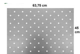
Gabarit de pose

Attention : En fonction du type de sol, le percement devra être réalisé avec unecarotteuse et des mèches diamant (ex : sol en pierre ou en marbre)