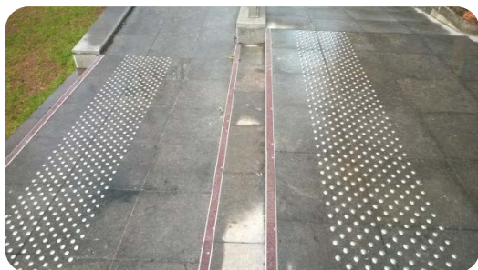
Eglise Saint Martin, Lille (59)