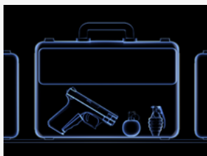
DÉTECTION DE MENACES DISSIMULÉES

Ce système d'inspection non-intrusif détecte les menaces dissimulées lors de contrôles douaniers, aéroportuaires, contre-mesure de surveillance technique (TSCM), lors d'interventions de déminage, de contrôle de bagage ou colis suspect, etc.