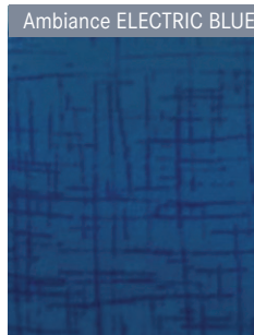
Ambiance ELECTRIC BLUE