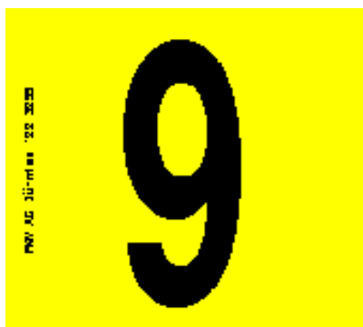
Etiquette avec chiffre réf. 300/105/116/252/106