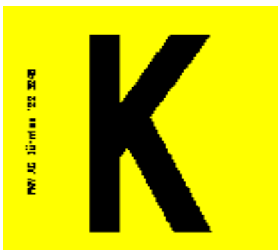
Etiquette avec lettre réf. 108/104/113/253/107