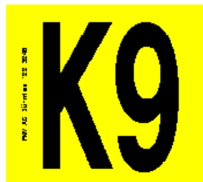
Etiquette avec lettre et chiffre (2 caractères) réf.100/101/202/254/205