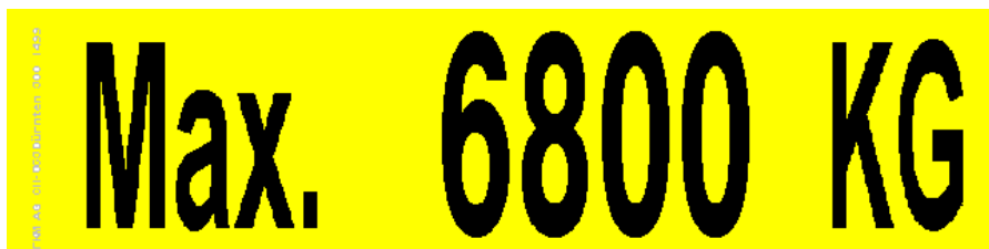
Etiquette de charge réf. 301/302