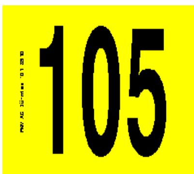
Etiquette avec chiffres réf. 102/206/255/204