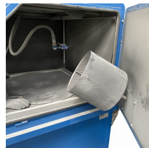
Panier tournant motorisé PT300E Disponible pour toutes les dimensions de cabines.