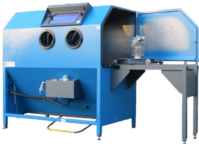
Chariot de chargement et plateau tournant CHARI