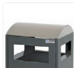
Tête en inox plein