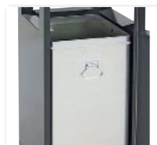
Réceptacle intérieur zingué