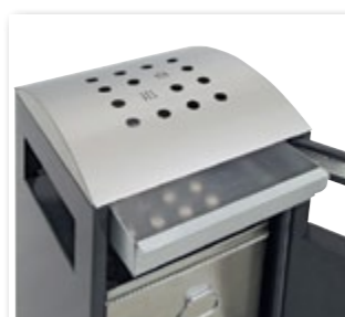
Tête en inox perforé