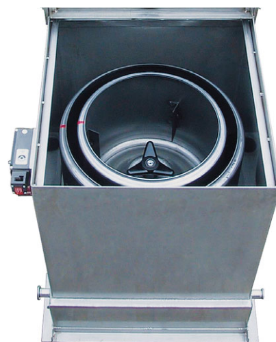
Option : version en acier inoxydable