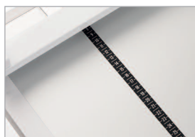
Table graduée en centimètres de chaque côté

Référence Désignation 0105 0100 IDEAL 0105