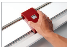
Tête de coupe ergonomique avec lame rotative coulissante