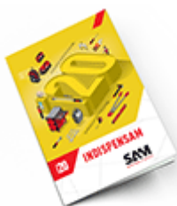
Les outils Indispensables SAM 2020

Découvrez tous nos produits dans nos catalogues en ligne