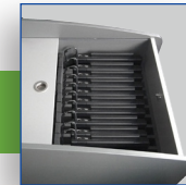
Intégration d'ordi- nateurs portables