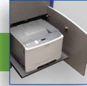
Intégration d'imprimante (option)