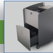
Grande capacité d'emport