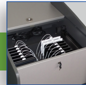
Intégration de tablettes