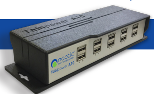
Tabipower® Charge intelligente pour appareils Android et iOS