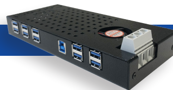
Tabiconnect® Charge & synchro intelligentes pour appareils Android et iOS