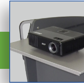
Plateau coulissant pour ordinateur ou projecteur