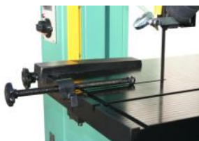
• Guide de largeur de coupe .