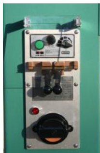
• Soudeur de lame avec meule et cisaille.