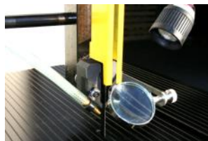
• Soufflage du tracé et loupe.