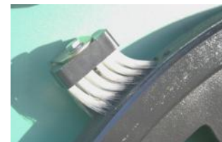
• Brosse nettoyage des volants .

Choisir, c'est prévenir. SYDERIC met à votre service 10.000 références SAV.