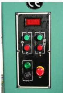
• Panneau de commande .