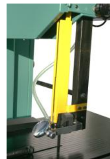
• Loupe et protecteur de lame .