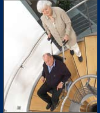
Escaliers raides, étroits ou en colimaçon - le c-max est polyvalent et franchit des marches de maximum 21 cm (en version standard)

Le c-max est équipé de freins de sécurité sur les roues qui l'arrêtent automatiquement en bord de marche. Les jambes d'appui se positionnent près de la contremarche. Elles n'endommagent pas le nez de marche, assurent un bon appui et réduisent le déplacement du centre de gravité lors du changement d'appui.