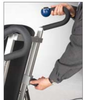
Les poignées sont réglables individuellement en hauteur, selon la taille de l'utilisateur et assurent une position optimale.