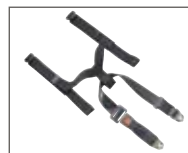
ceinture 5 points