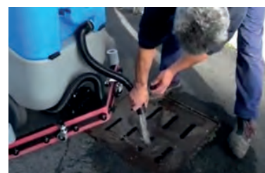
Flexible de vidange situé à l'arrière de l'autolaveuse