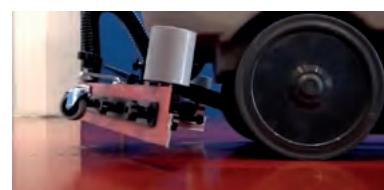
Relevage du suceur électrique