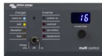
Tableau de commande numérique Multi Control

Afin d'implémenter les fonctions PowerControl et PowerAssist et pour optimiser l'autoconsommation grâce à une sonde de courant externe. Courant maximal : 50 A, 100 A respectivement. Longueur du câble de connexion : 1 m.