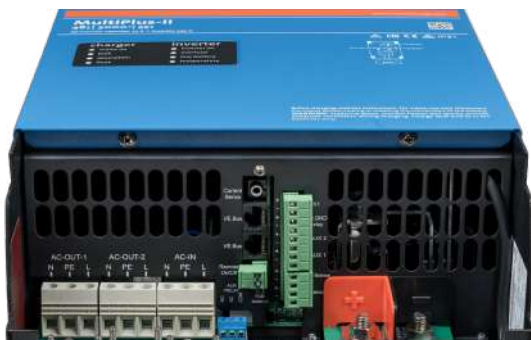
Zone de connexion

Permet de mesurer la tension de batterie et la température et de superviser et contrôler le système avec un Smartphone ou tout autre dispositif équipé de Bluetooth.