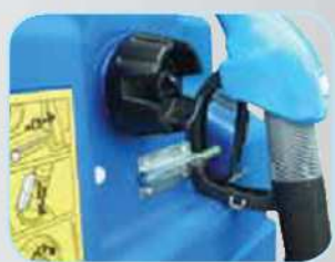
Bouchon avec évent et support pistolet