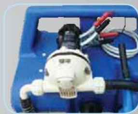
Pompe électrique 12V à membrane