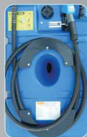
Paroi anti-roulis centrale