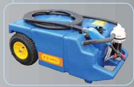
Passages de sangles