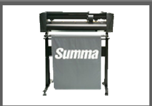
SUMMA SUMMACUT D 60R