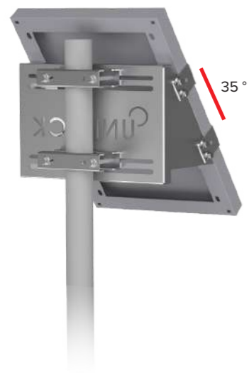
UNIFIX 5SF Pour Unisun 5.12 M Orientation portrait Tête et milieu de mât Brides de fixation en option Ref 2693