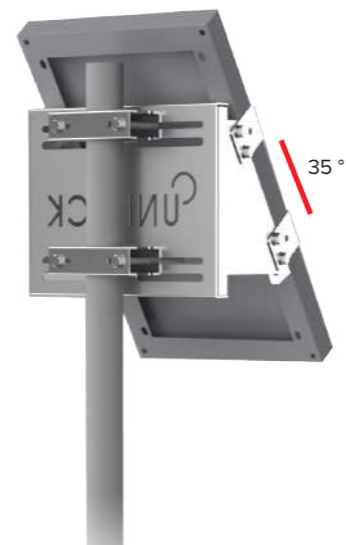
UNIFIX 20SF Pour Unisun 10.12M/ 10.24M/ 20.12M/ 20.24M Orientation portrait Tête et milieu de mât Brides de fixation en option Ref 1139