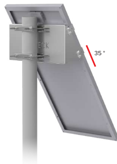
UNIFIX 100SF Pour Unisun 80.12M/ 100.12M/ 100.24M/ 120.12BC Orientation portrait Tête de mât Brides de fixation en option Ref 1146