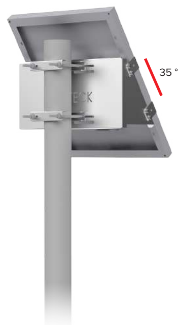
UNIFIX 50SF Pour Unisun 30.12M/ 50.12M/ 50.24M/ 55.12BC Orientation portrait Tête et milieu de mât Brides de fixation en option Ref 0064