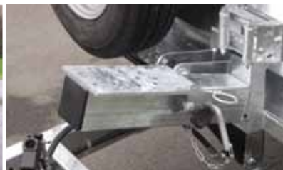
Support de treuil et guide câble de treuil