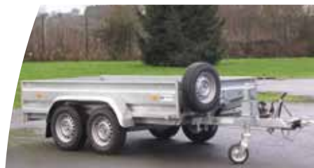
Roue de secours

Cette gamme permet de nombreuses options (support de treuil, ridelles grillagées, bâche haute, filet à feuilles...).