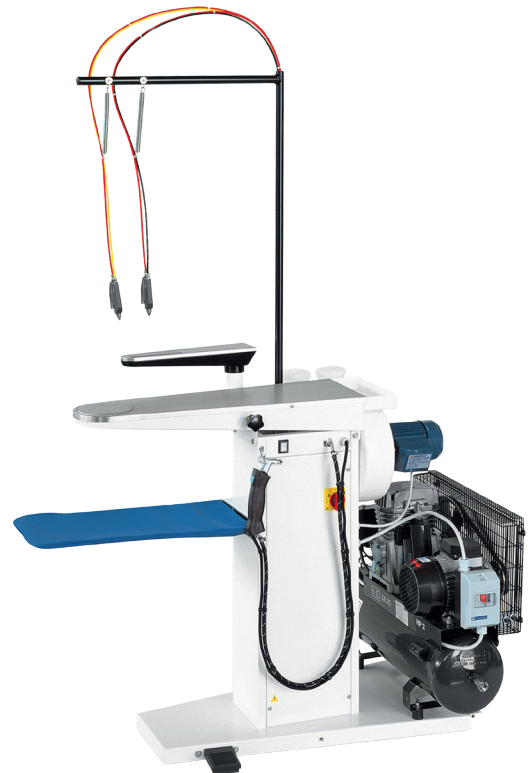
TAD avec compresseur