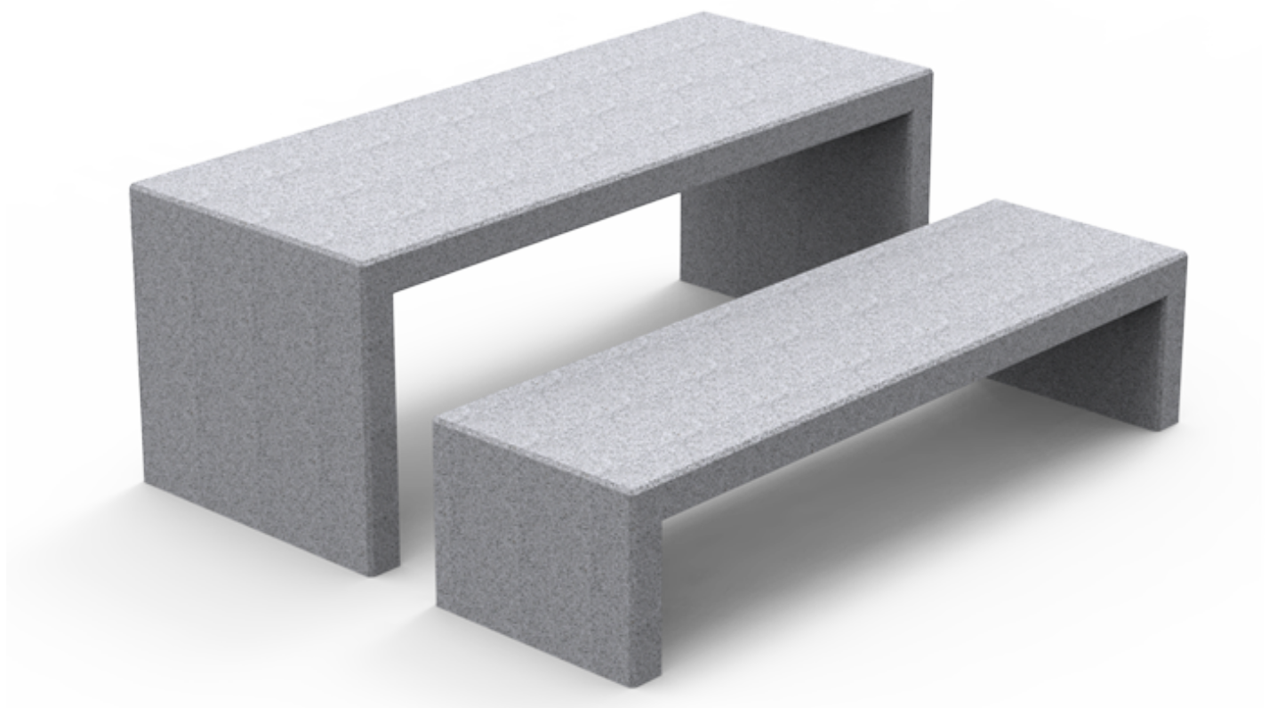
Table en béton préfabriqué coloris gris granite d'aspect lisse. Ancrage recommandé : posée au sol.