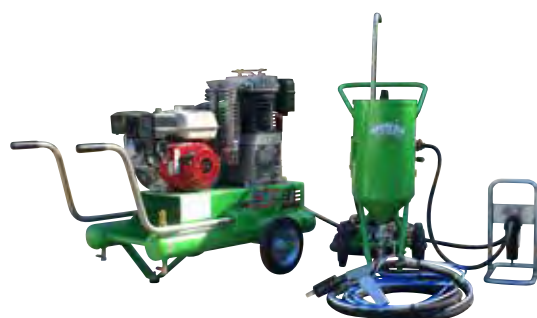
KIT TOPOLINO 18