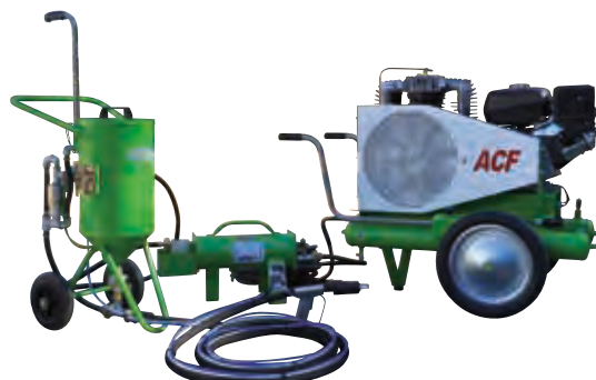
MAXI TOPOLINO 18