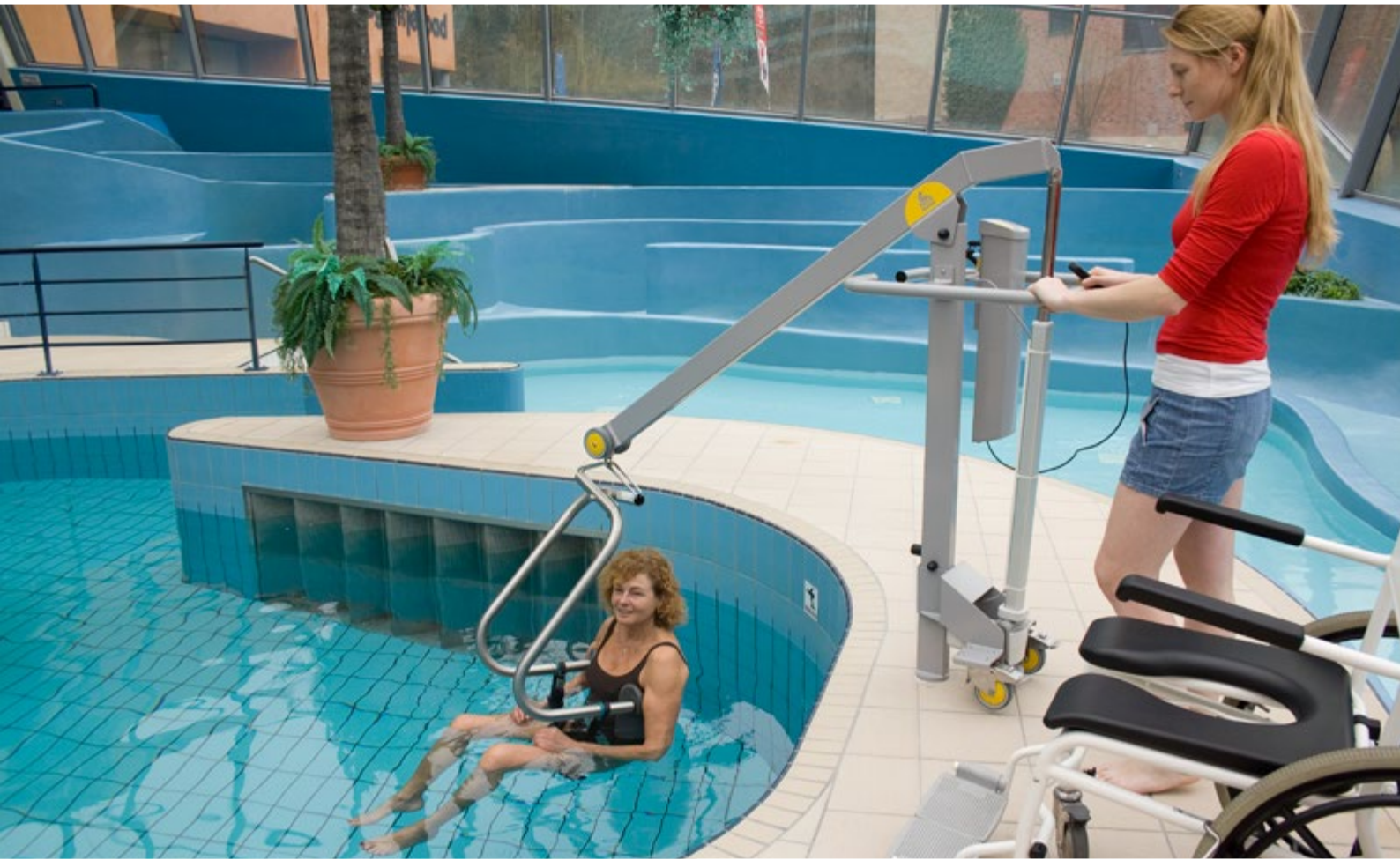
∨ Lève-personne de piscine avec châssis-mains