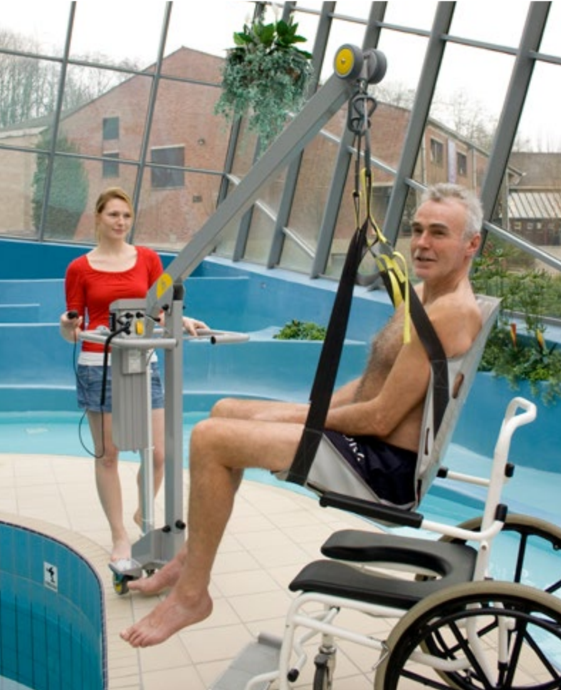
∧ Lève-personne de piscine avec siège de bain