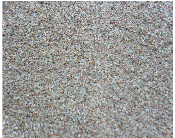
Sable de filtration TEN 0,55.