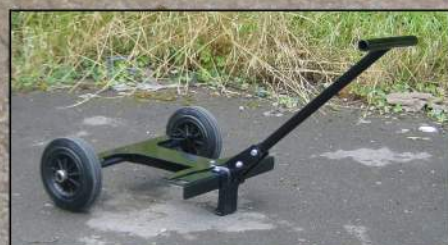
Kit chariot en option