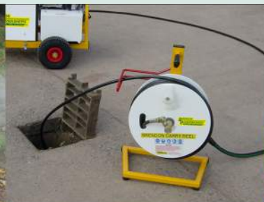
Kit de débouchage