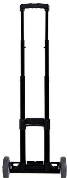
Trolley 3-étages Poignée extensible 392 - 980 mm Grandes roues