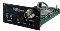
RP-5100M MODULE REEMETTEUR UHF 100 FREQ. SANS FIL

Lecteur Numérique CD/USB/SD avec télécommande