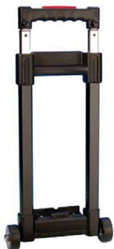
Trolley 2-étages Poignée extensible 420 - 960 mm