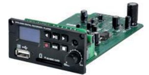
DPR-500M LECTEUR ENREGISTREUR NUMERIQUE MP3 / USB