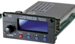
SDR-8200M-IRDA MODULE RECEPTEUR UHF 100 FREQ. 2 VOIES SYNC. TRUE DIVERSITY