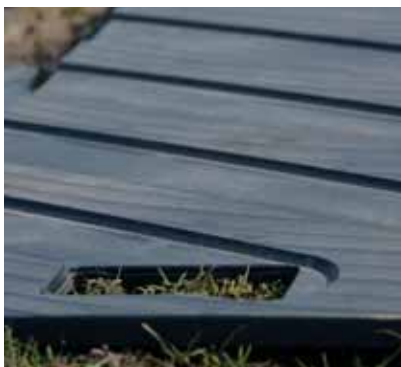
Anti-slip for better grip Power-plates crantés Antislip voor betere grip