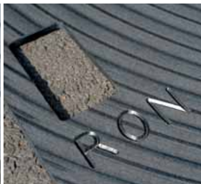
Personalisation Personalisation Personalisatie