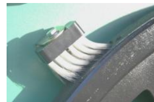
• Brosse nettoyage des volants .

Choisir, c'est prévenir. SYDERIC met à votre service 10.000 références SAV.