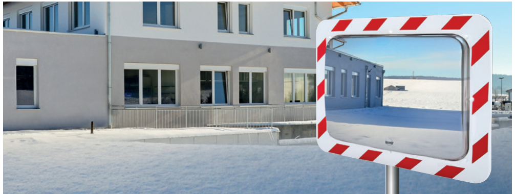
Réf. 858 AB