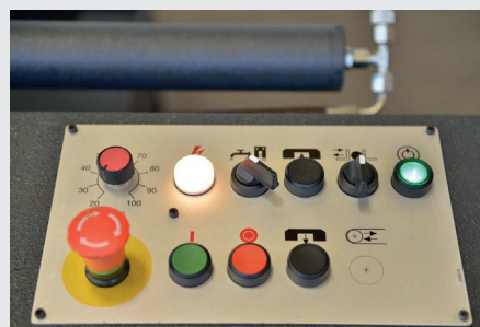
FIG.: PANNEAU DE COMMANDE