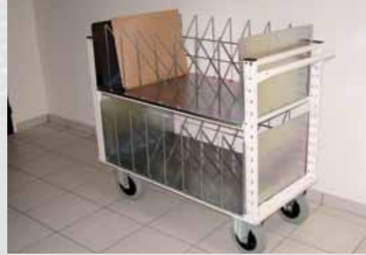
Chariot pour radiologie