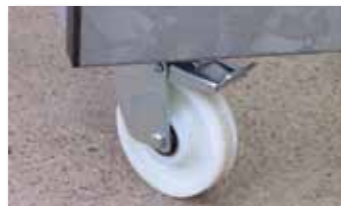
Embase mécanosoudée pour une meilleure solidité.