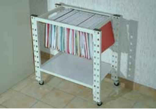
Chariot dossiers suspendus