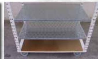
Dessus de tablette: MDF 3mm, PVC, ou galvanisé.