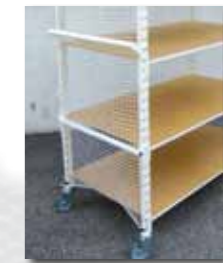
Filet de protection