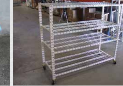
Chariot avec dessus grillagé