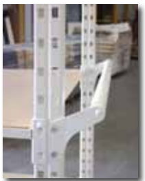
Poignée de manutention