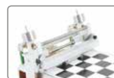
Fixation combinée d'un applicateur de film et d'un filmographe à spirales