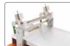
Fixation de filmographe à spirales