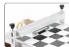
Fixation d'applicateur de film

Chaque table est fabriquée pour une planéité absolue et est jusqu'à cinq fois plus plane que le verre. Une table Elcometer peut être fournie avec de nombreuses options correspondant à votre matériel d'essai précis. Il suffit pour cela de sélectionner le modèle désiré dans le tableau des spécifications techniques ci-dessous.