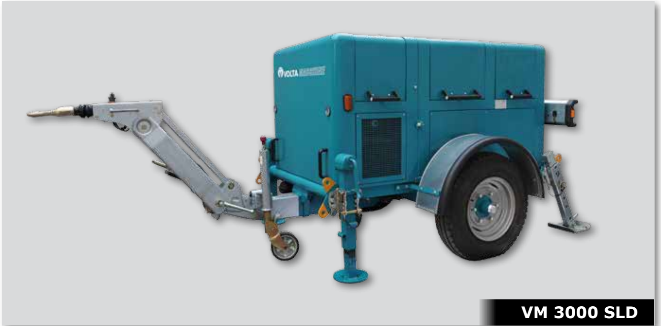
VM 3000 SLD