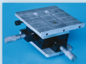
Table 3 axes