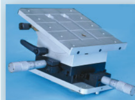
Table 4 axes

Déplacements : X et Y et rotation en Z (pour le positionnement des pièces cylindriques)