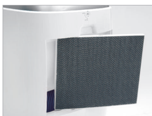
Cartouche de filtres combinés (filtre HEPA + filtre au charbon actif).