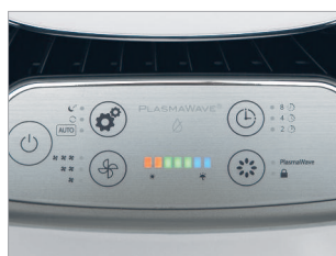
Panneau de commande avec indicateur du taux d'humidité ambiant.