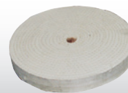
Fig. : Disque dur