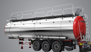
Ergonomie et confort de travail

Double passerelle et double rambarde offrant une sécurisation totale de la partie supérieure de la citerne