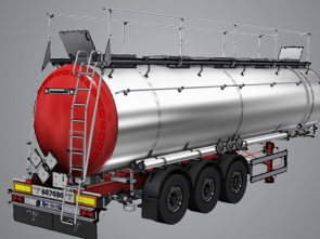
Conforme à la directive ADR

Véhicule répondant à l'ensemble de l'ADR