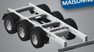
Châssis autoportant polyvalent

Citerne dédiée au transport de produits chimiques. Réalisation en inox 304, 316 ou Uranus B6