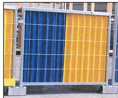
Réf : 151206