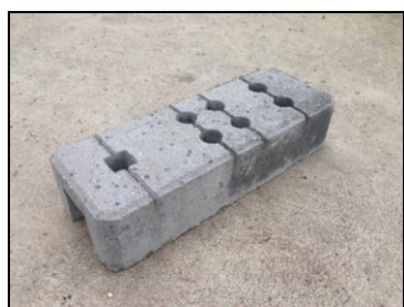
Réf : 151407