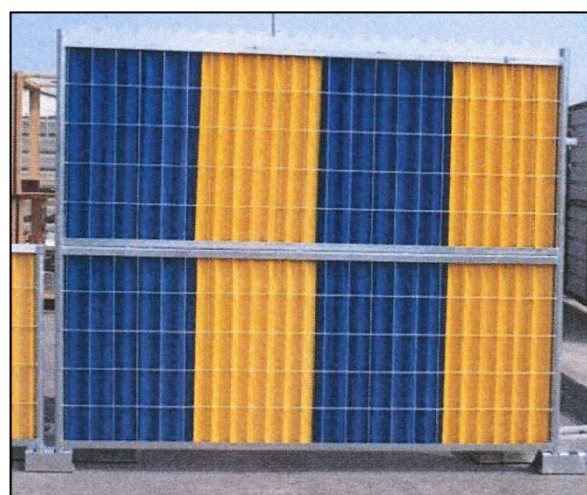
Réf : 151208