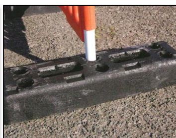
Réf : 25412