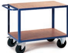
Chariot 2 plateaux