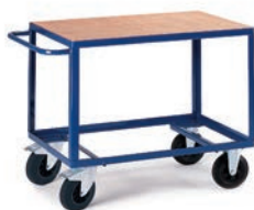
Chariot 1 plateau