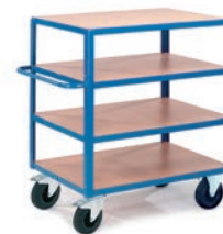
Chariot 4 plateaux