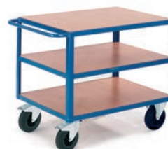
Chariot 3 plateaux