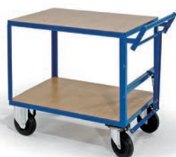
Chariot 2 plateaux