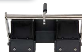
4 in x 4 in x 4 in SmartDie II

Une large gamme de sabots vous permet de tracer des bandes simples (5-30 cm), des bandes entrecoupées, ainsi que des doubles bandes à l'aide du kit d'application sabot « double bande ». L'utilisation de gabarits vous permet de dessiner des légendes, des panneaux d'arrêt et d'avertissement.