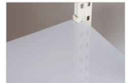
Dessus PS Choc