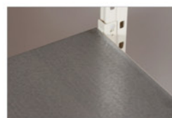
Dessus tôle galvanisée