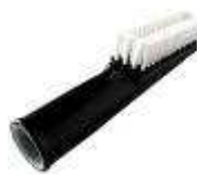
Brosse douce pour vêtement