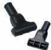
Turbo brosse pour vêtement