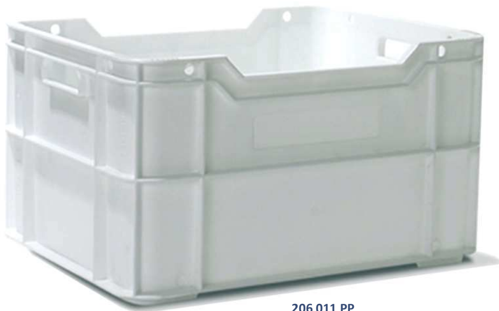
206 011 PP