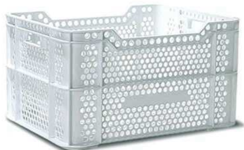
206 011 AA