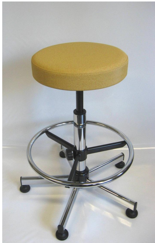
Visuel du tabouret 19 avec repose-pieds RPTL

Pour faciliter le nettoyage et la décontamination, le dessous de cette assise est recouvert par une feuille de vinyle étanche. L'assise, qui ne comporte pas d'agrafe, est exempte d'impuretés.